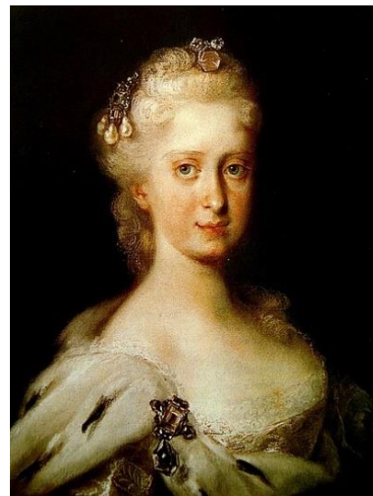
Rosalba Carriera: Maria Josepha von Sachsen (Gemäldegalerie Alte Meister zu Dresden)

1723 war Bach als Thomaskantor nach Leipzig gekommen und in den ersten Jahren komponierte er mehrere Kantatenjahrgänge für die Gottesdienste in den Leipziger Hauptkirchen St. Thomas und St. Nikolai. Nach einigen Jahren wurde die Regelung für die Aufnahme der Thomaner dahingehend geändert, dass nicht mehr die musikalische Qualität der Jungen im Vordergrund stand. Das erschwerte für Bach die Möglichkeit, musikalisch anspruchsvolle Kantaten im Gottesdienst aufzuführen.